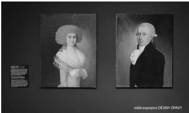
stálá expoze DĚJINY OPAVY

út–ne 10:00–18:00 / 1. neděle v měsíci vstup zdarma vstupné základní 40,- / zlevněné 20,- / rodinné 90,- / skupinové vstupné dospělí (min. 10 osob) 20,- za osobu / školní skupiny 10,- za žáka, pedagogický dozor zdarma / platí pro všechny výstavy