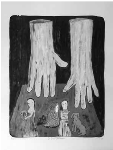
autor / Eva Natus-Šalamounová / výstava STO LET HOLLARU

VSTUPNÉ základní 40,- / zlevněné 20,- / rodinné 90,- / skupinové vstupné dospělí (min. 10 osob) 20,- za osobu / školní skupiny 10,- za žáka, pedagogický dozor zdarma / platí pro všechny výstavy