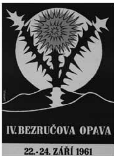
výstava BEZRUČOVA OPAVA NA PLAKÁTECH (1958–2017)