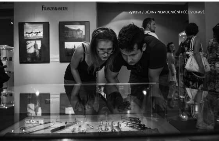
výstava / DĚJINY NEMOCNIČNÍ PÉČE V OPAVĚ

NUTNÁ PŘEDCHOZÍ REZERVACE na tel. +420 734 518 907 nebo na recepci Obecního domu. Vstupenku zakoupíte na místě.